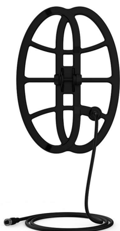
Δίσκος BEAST 33 εκ. (αξεσουάρ)