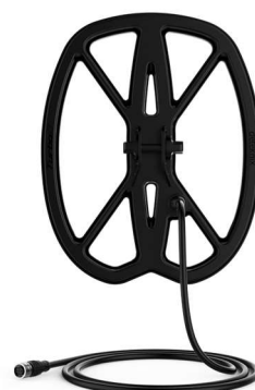
Δίσκος RAPTOR 28 εκ. (στο βασικό εξοπλισμό)