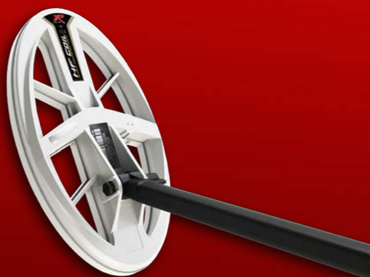
Ελλειπτικός δίσκος HF