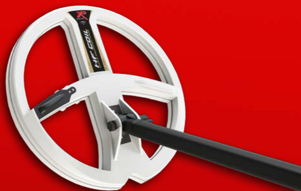
22,5 εκ. δίσκος HF