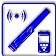
ΣΥΝΔΕΣΗ PINPOINTER MI-6