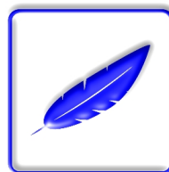
ΜΟΝΟΝ 770 ΓΡΑΜ.