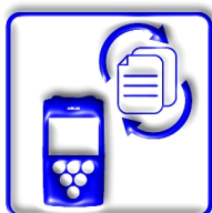
ΔΩΡΕΑΝ ΑΝΑΒΑΘΜΙΣΕΙΣ ΧΡ