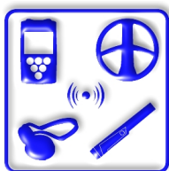
ΑΣΥΡΜΑΤΗ ΤΕΧΝΟΛΟΓΙΑ ΧΡ