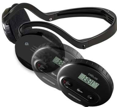
Ασύρματα ακουστικά WS 4 ή WS5