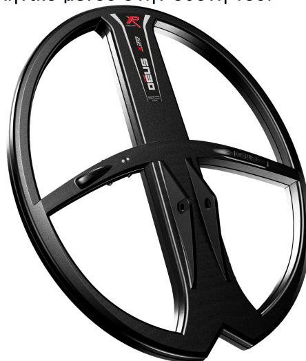
Δίσκος X35 34 X 28 εκ.