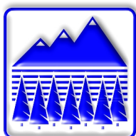
ΓΙΑ ΟΛΑ ΤΑ ΕΔΑΦΗ