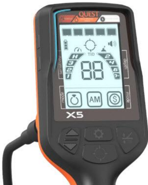
Σκίαστρο & προστασία οθόνης

Οι ανιχνευτές μετάλλων QUEST της σειράς X έχουν την ίδια δομή με τη σειρά QUEST Q. Η κονσόλα χειρισμών επενδύεται από χυτό, μαλακό πλαστικό TPU. Τα πλήκτρα καλύπτονται άψογα κάτω από τη στρώση του για μεγαλύτερη διάρκεια ζωής. Ο καινοτόμος σχεδιαστικά προφυλακτήρας χρώματος που προεξέχει δεν είναι απλά διακοσμητικό στοιχείο αλλά παρέχει μεγαλύτερη προστασία έναντι ατυχημάτων από πτώσεις στο έδαφος. Ο νέος λαξευτός σχεδιασμός διαμαντιού στο πίσω κέλυφος δείχνει νεότερος. Βελτιστοποιημένη λαβή και αναλογίες κονσόλας που είναι μικρότερη και πιο άνετη από τις παραδοσιακές.