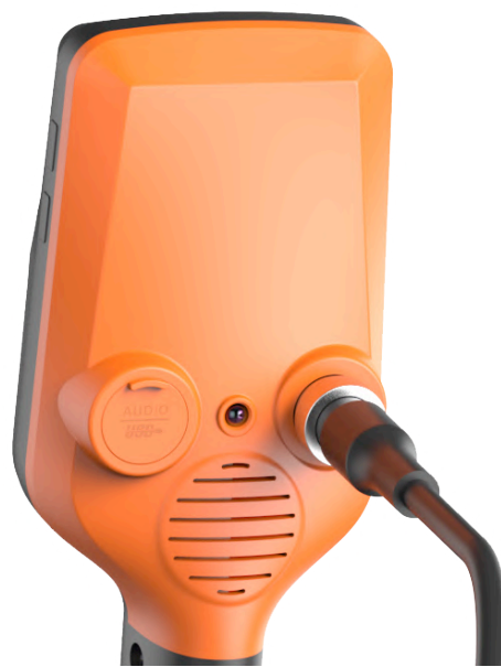
Διαμαντωτή λάξευση κονσόλας