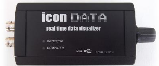
ICON DATA καταγραφέας δεδομένων