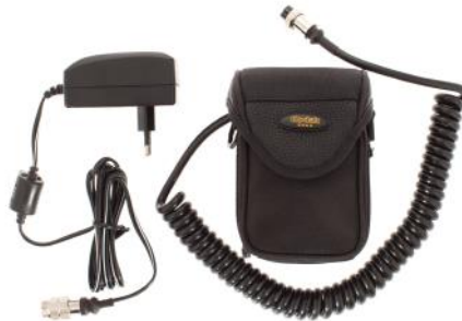
εξωτερικό rack μπαταρίας 12 V